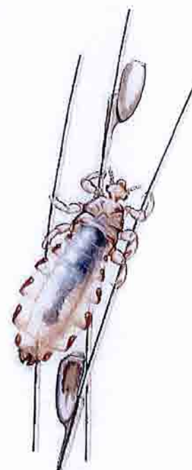
Figur 1. Hodelus (Illustrasjon: Hallvard Elven)

Eggene er 0,3 x 0,8 mm, og de er godt festet til hårstråene. De er gulhvite og gjennomsiktige når de har innhold, og blir papiraktig hvite etter at de har klekket. Egget har et lokk som faller av ved klekking (figur 4). Tomme eggeskall kjennes på at de mangler lokk og er renere hvite. Egg som er drept med insektmidler beholder lokket og får med tiden en brunlig farge når innholdet tørker inn. Man kan se eggene med det blotte øyet, men for å se detaljer er lupe nødvendig.