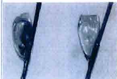
Figur 4. Egg med embryo (t.v.) og egg som har klekket (t.h.)