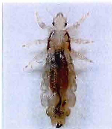
Figur 2. Voksne hodelus er 2-3 mm lange