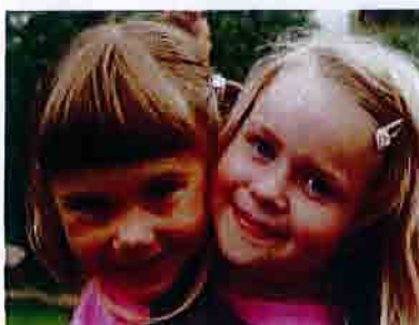
Fig. 6 Hodelus smitter ved nærkontakt

Det finnes likevel en viss mulighet for at lus kan spres med kammer og børster, og vask eller frysing av disse bør gjennomføres. Å låne hodeplagg av en med lus anbefales ikke, selv om sjansen for spredning med luer anses som liten.