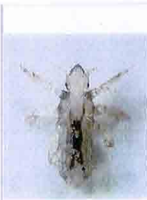
Figur 3. Nymfer (unger) er mindre enn voksne lus